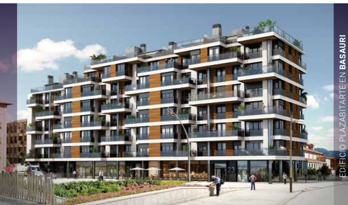
EDIFICIO PLAZABITARTE EN BASAURI

Honelakoak dira Grupo Eibar -ren beste PLAZAK