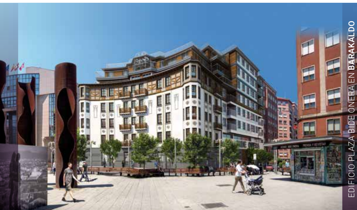
EDIFICIO PLAZA BIDE ONERA EN BARAKALDO

Honelakoak dira Grupo Eibar-ren beste PLAZAK, Plaza Bideonera Eraikina Barakaldon , Plazabitarte Eraikina Basaurin ; berezko estiloa duten eraikin paregabeak, xarma duten kokaguneetan.