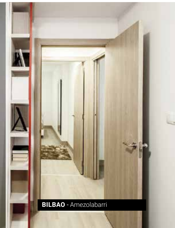
BILBAO - Amezolabbarri