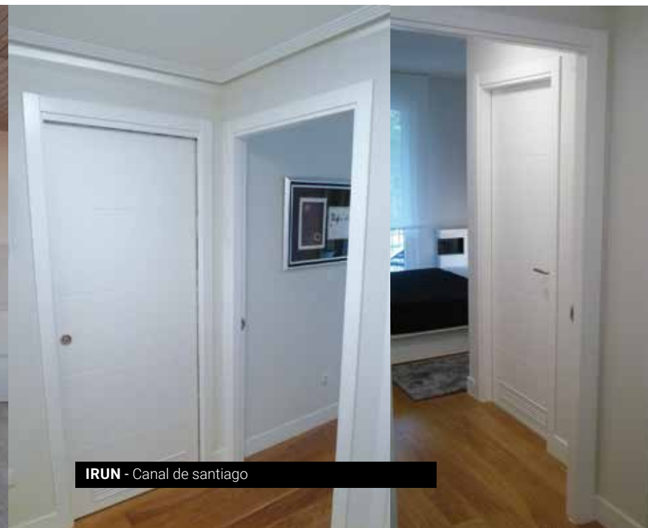
IRUN - Canal de santiago