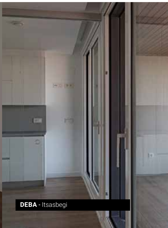
DEBA - Itsasbegi