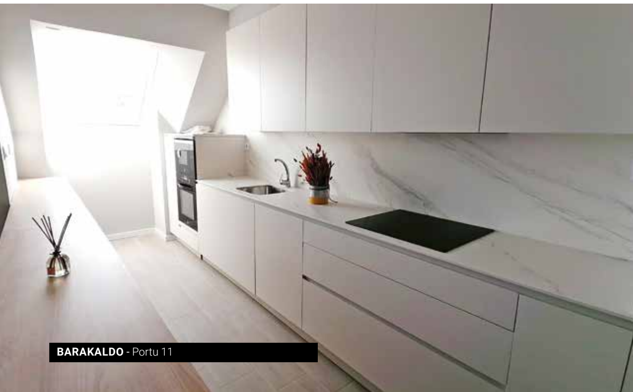
BARAKALDO - Portu 11