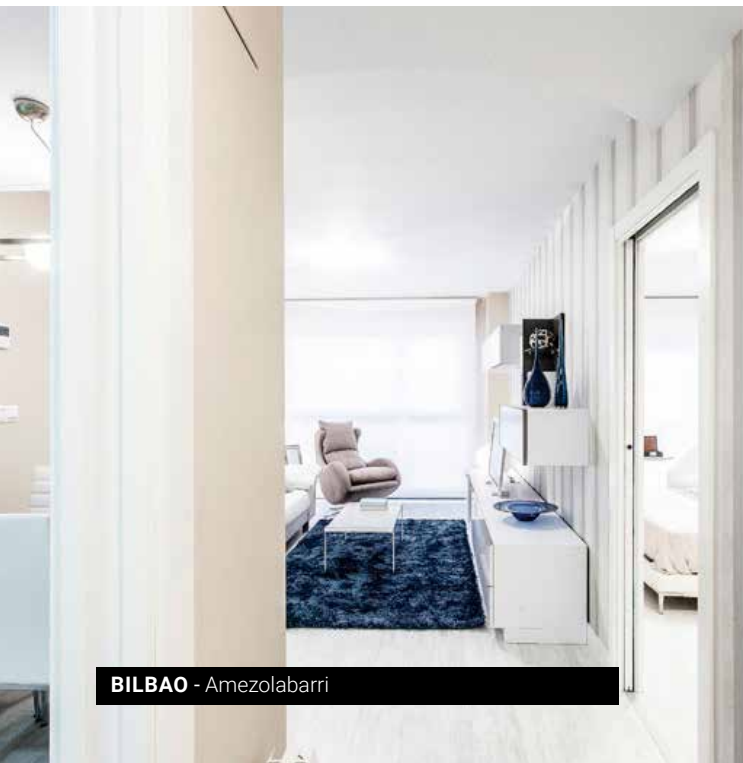
BILBAO - Amezolabari