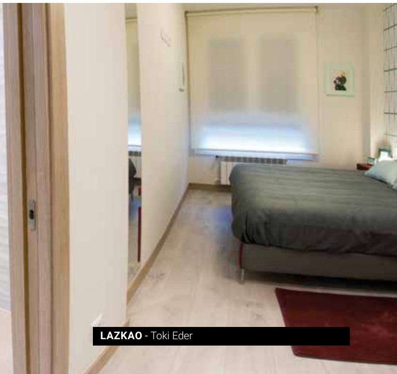
LAZKAO - Toki Eder