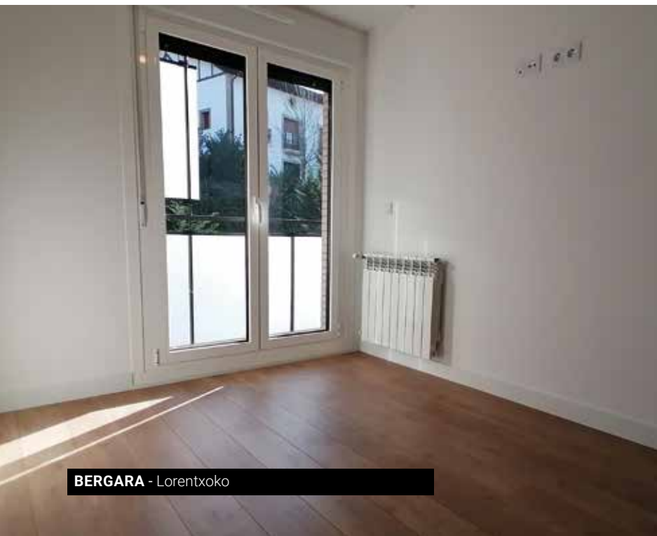
BERGARA - Lorentxoko