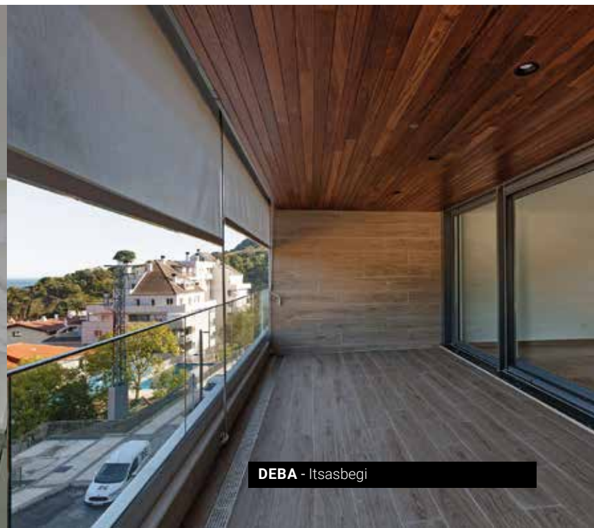
DEBA - Itsasbegi