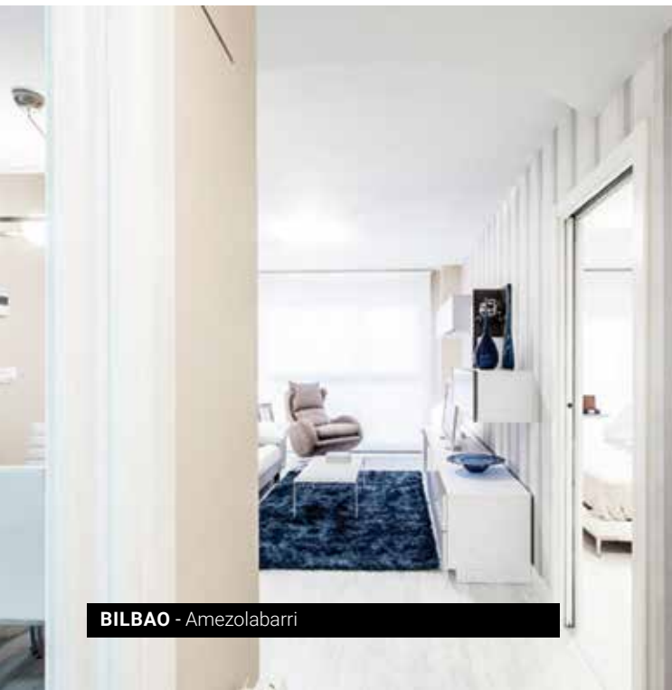
BILBAO - Amezolabari

Parte de la energía necesaria para la producción de ACS se obtendrá a través de energías renovables.