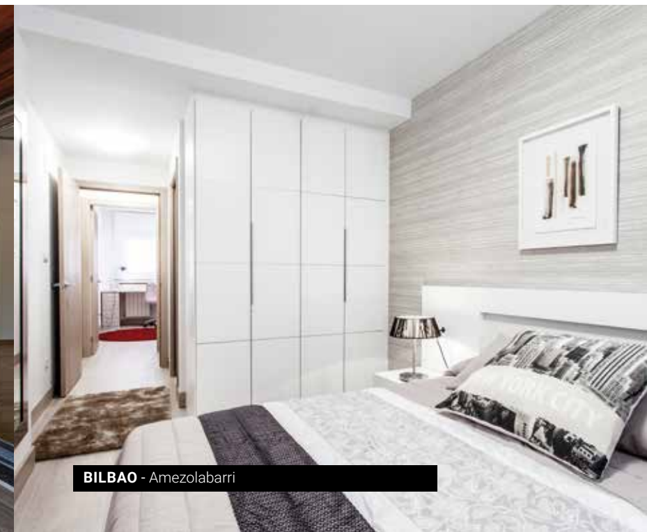
BILBAO - Amezolabari