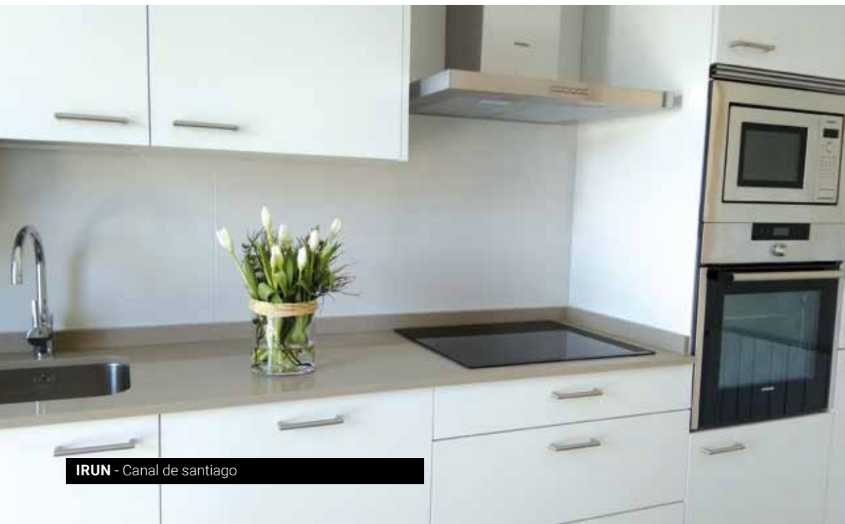
IRUN - Canal de Santiago