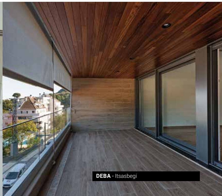
DEBA - Itsasbegi