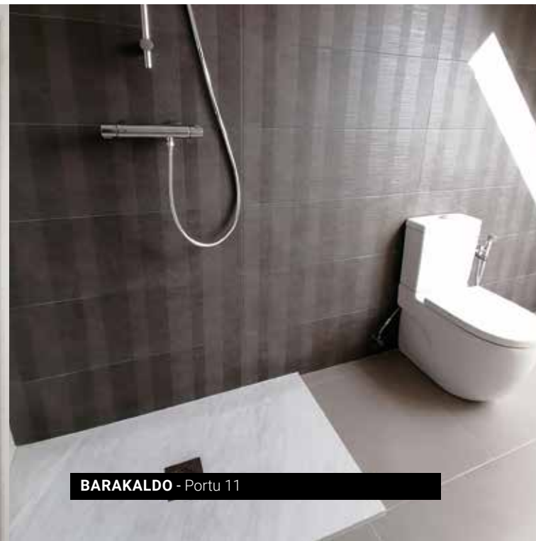
BARAKALDO - Portu 11