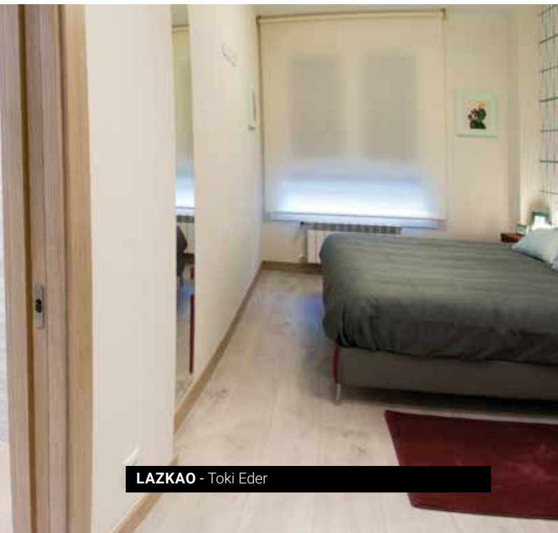
LAZKAO - Toki Eder