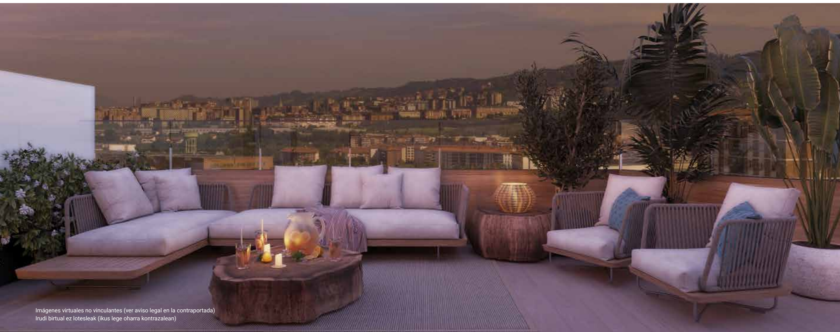
Imágenes virtuales no vinculantes (ver aviso legal en la contraportada) Irudi birtual ez lotesleak (ikus lege oharra kontrazalean)