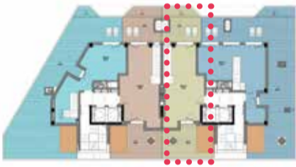
PORTAL2 · BC A (Dúplex)

Medidas y distribuciones aproximadas. Disposición de mobiliario de cocina a definir. La dimensión de los pilares y mochetas especificadas en los planos de planta es la sección estándar, pudiendo aumentar o disminuir la misma por altura de la planta en la que se ubique la vivienda y por el paso de las instalaciones. Del mismo modo, pueden aparecer nuevas mochetas y pasos de instalaciones del edificio que no vienen reflejadas en los planos.