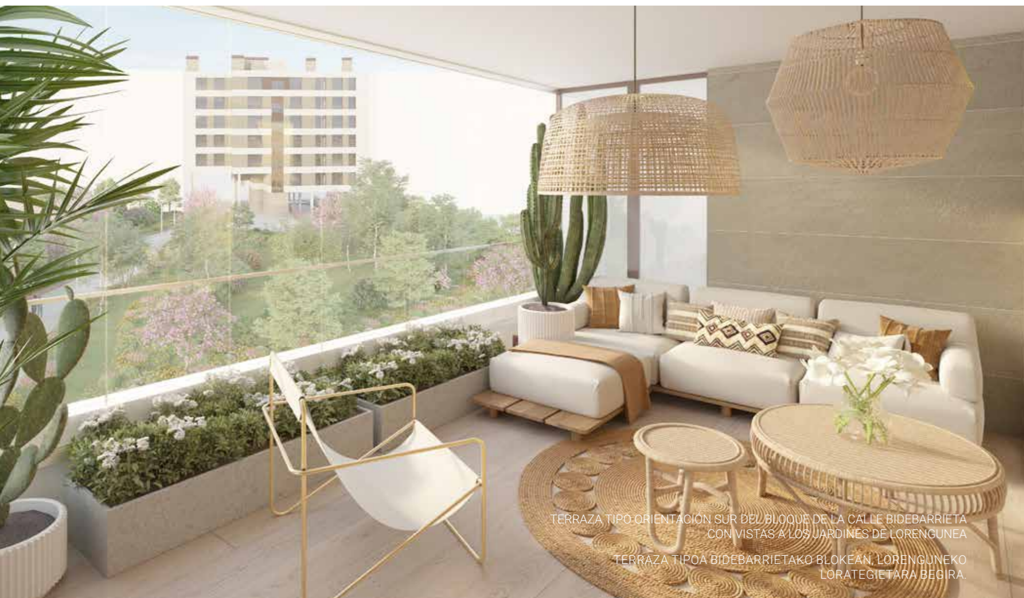
TERRAZA TIPO-ORIENTACIÓN SUR DEL BLOQUE DE LA CALLE BIDEBARRIETA CON VISTAS A LOS JARDINES DE LORENGUNEA TERRAZA TIPOA BIDEBARRIETAKO BLOKEAN, LORENGUNEA LORATEGIETARA BEGIRA.