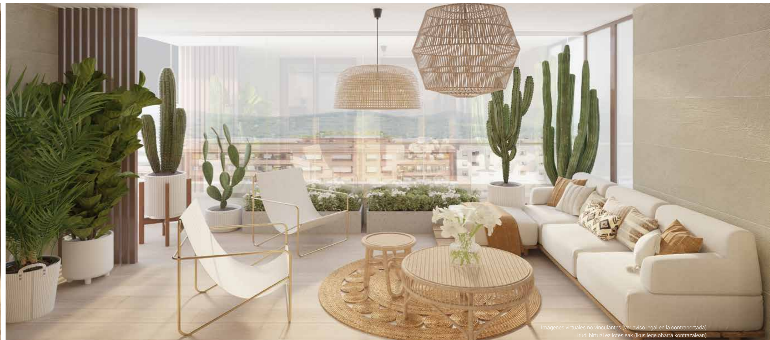
Imágenes virtuales no vinculantes (ver aviso legal en la contraportada) Irudi birtual ez lotesleak (ikus lege oharra kontrazalean)

El bloque de la calle Bidebarrieta se compone de 4 portales con 2 viviendas de doble orientación y amplias terrazas al sur. Sol todo el día y amplitud al aire libre. Terrazas recogidas para crear tus espacios más tranquilos y con vistas a los jardines de Lorengunea. Todo un privilegio para una vivienda dentro de un entorno urbano.