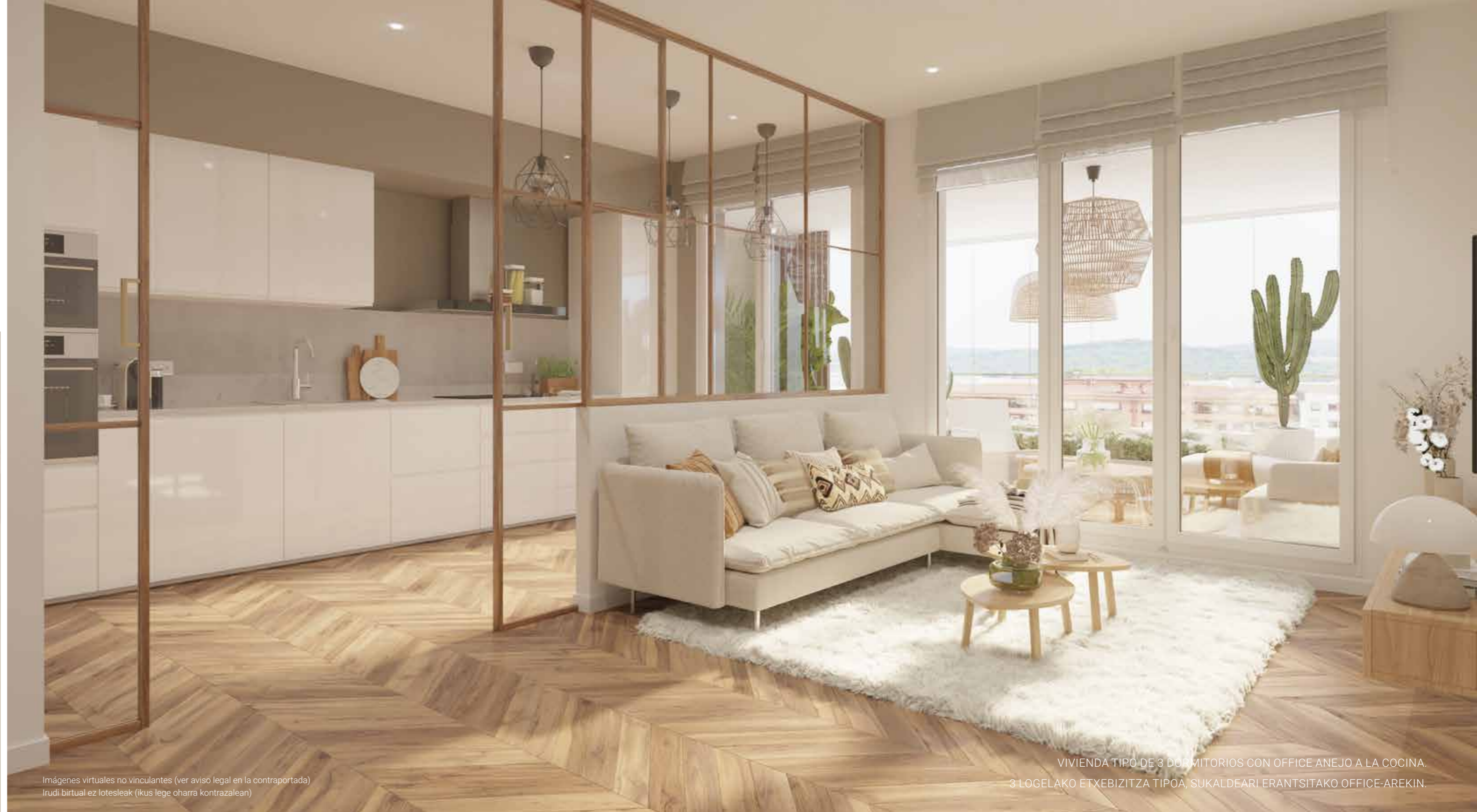
Imágenes virtuales no vinculantes (ver aviso legal en la contraportada) Irudi birtual ez lotesleak (ikus lege oharra kontrazalean)