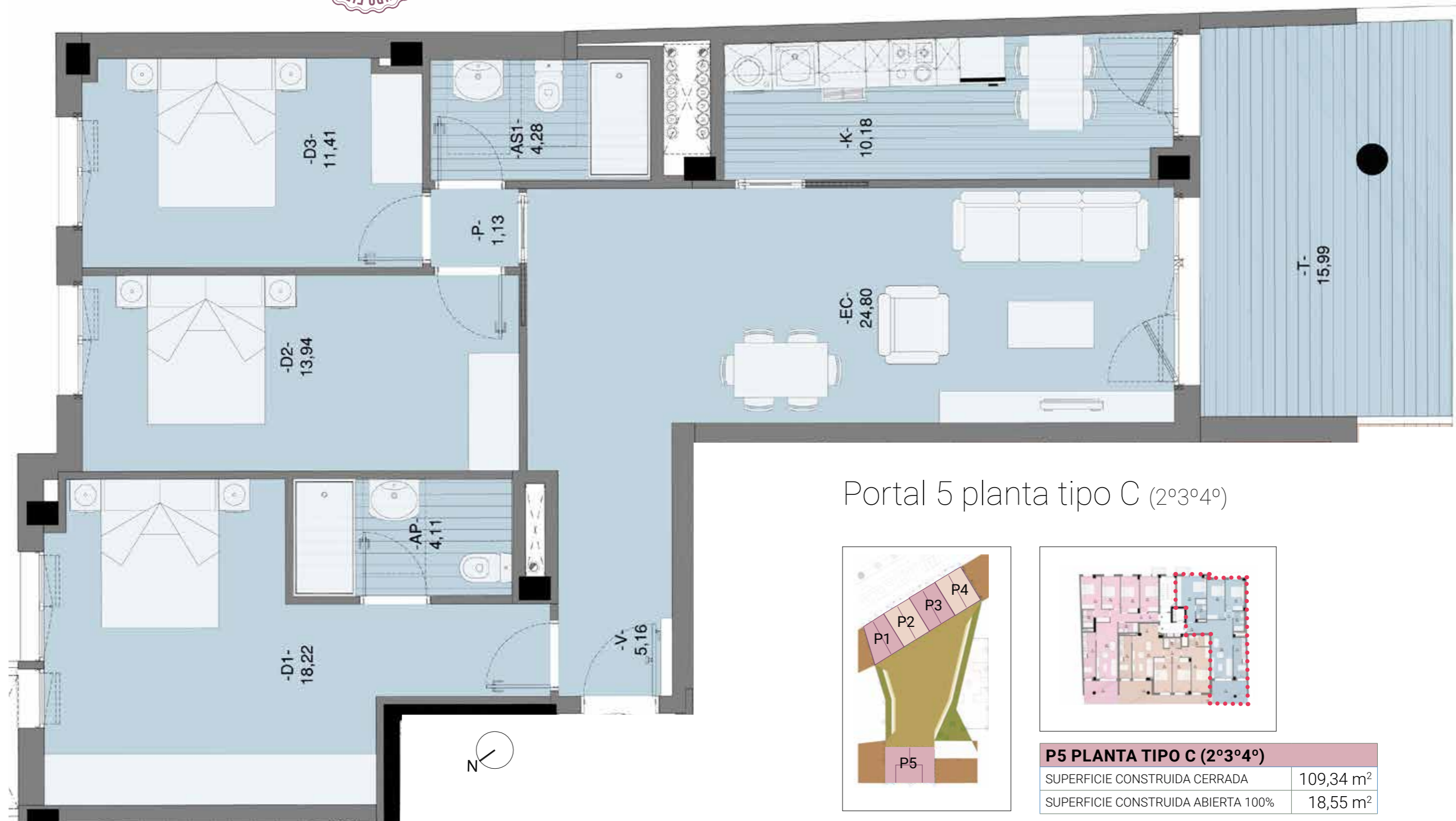
Portal 5 planta tipo C (2º3º4º)