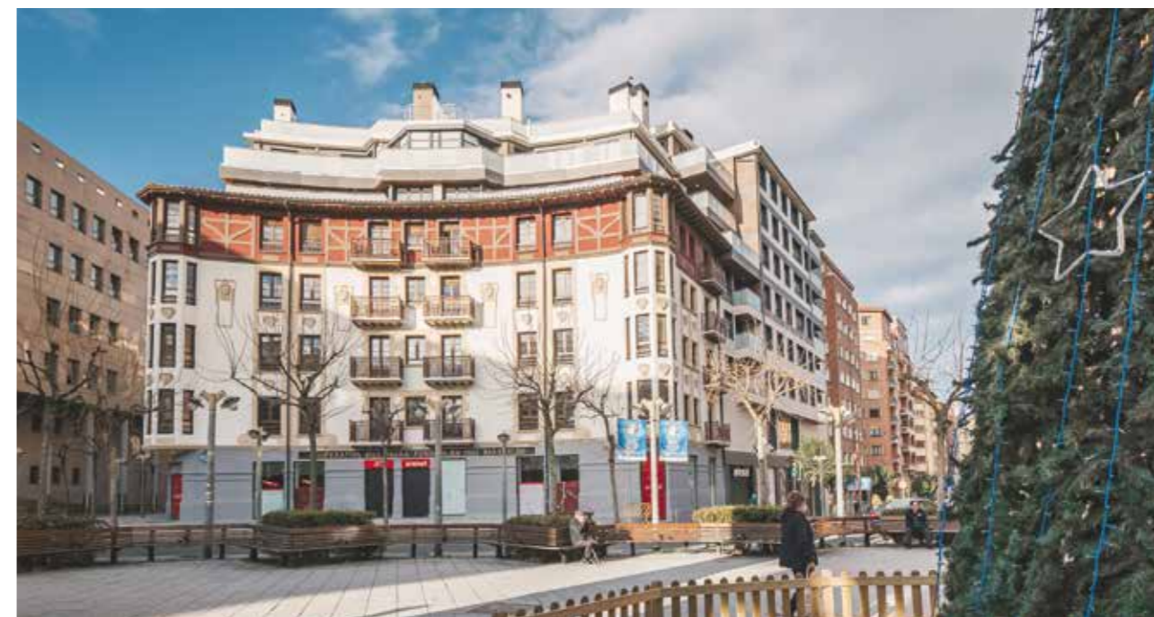
EDIFICIO BIDE ONERA: El respeto por mantener la identidad no esta reñido con que nuestros edificios cuenten con los últimos avances en sostenibilidad.

ayudan a mejorar cada día aplicando los últimos avances en la materia, lo que nos permite concebir y construir hogares eficientes, limpios y con un alto porcentaje de consumo de energías renovables con garantía de calidad y sostenibilidad.