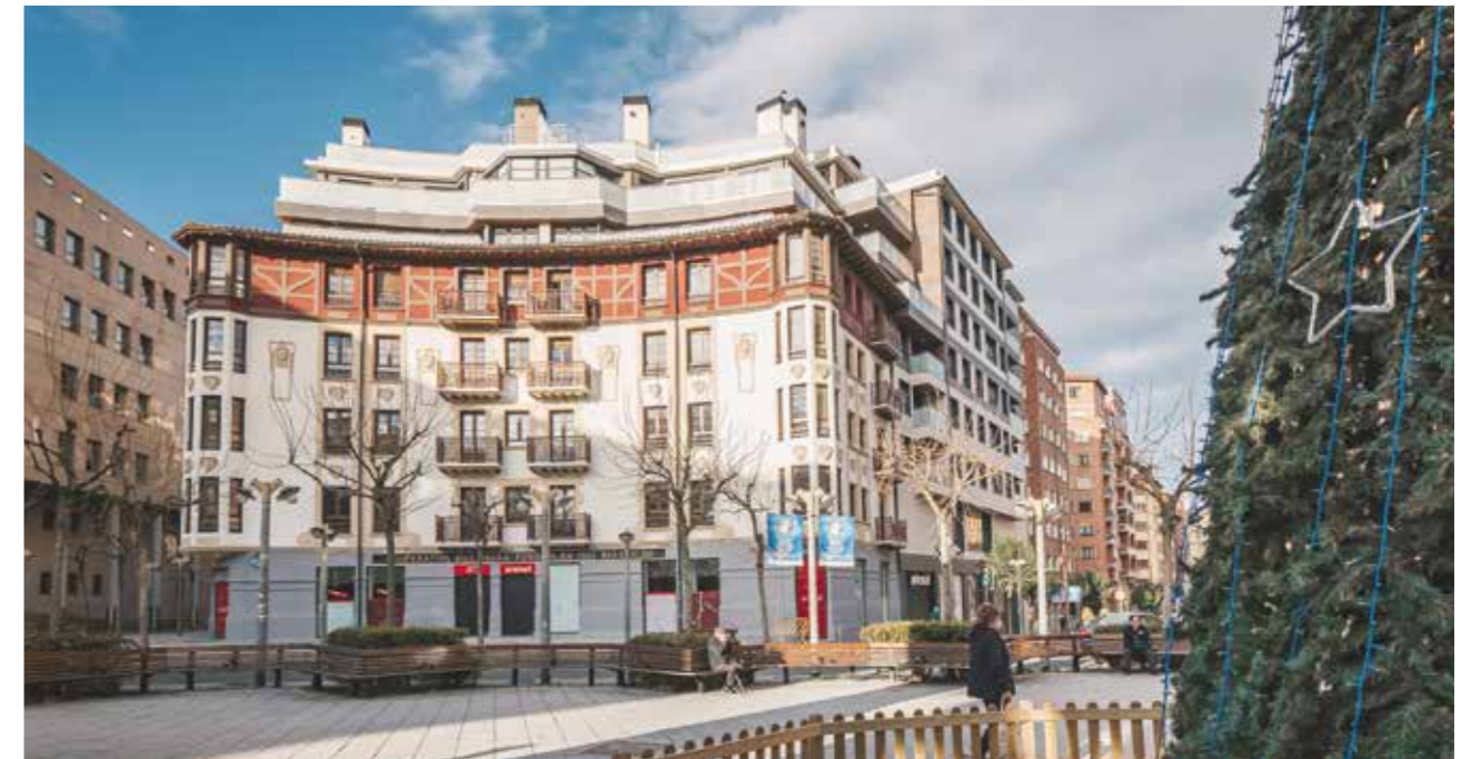
BIDEONERA ERAIKINA: nortasunari eusteko errespetua gure eraikinek jasangarritasunaren arloan azken aurrerapenak izatearekin bateragarria da

hobetzen laguntzen diguten espezialistak ditugu euskarri, eta horiei esker, etxe efizienteak, garbiak eta energia berriztagarrien kontsumo portzentai handiak eskaintzen dituztenak sortu eta eraiki ditzakegu, kalitatea eta jasangarritasuna bermatuta.