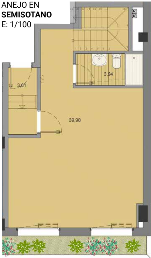
ANEJO EN SEMISOTANO E: 1/100

Medidas y distribuciones aproximadas. Disposición de mobiliario de cocina a definir. La dimensión de los pilares y mochetas especificadas en los planos de planta es la sección estándar, pudiendo aumentar o disminuir la misma por altura de la planta en la que se ubique la vivienda y por el paso de las instalaciones. Del mismo modo, pueden aparecer nuevas mochetas y pasos de instalaciones del edificio que no vienen reflejadas en los planos.