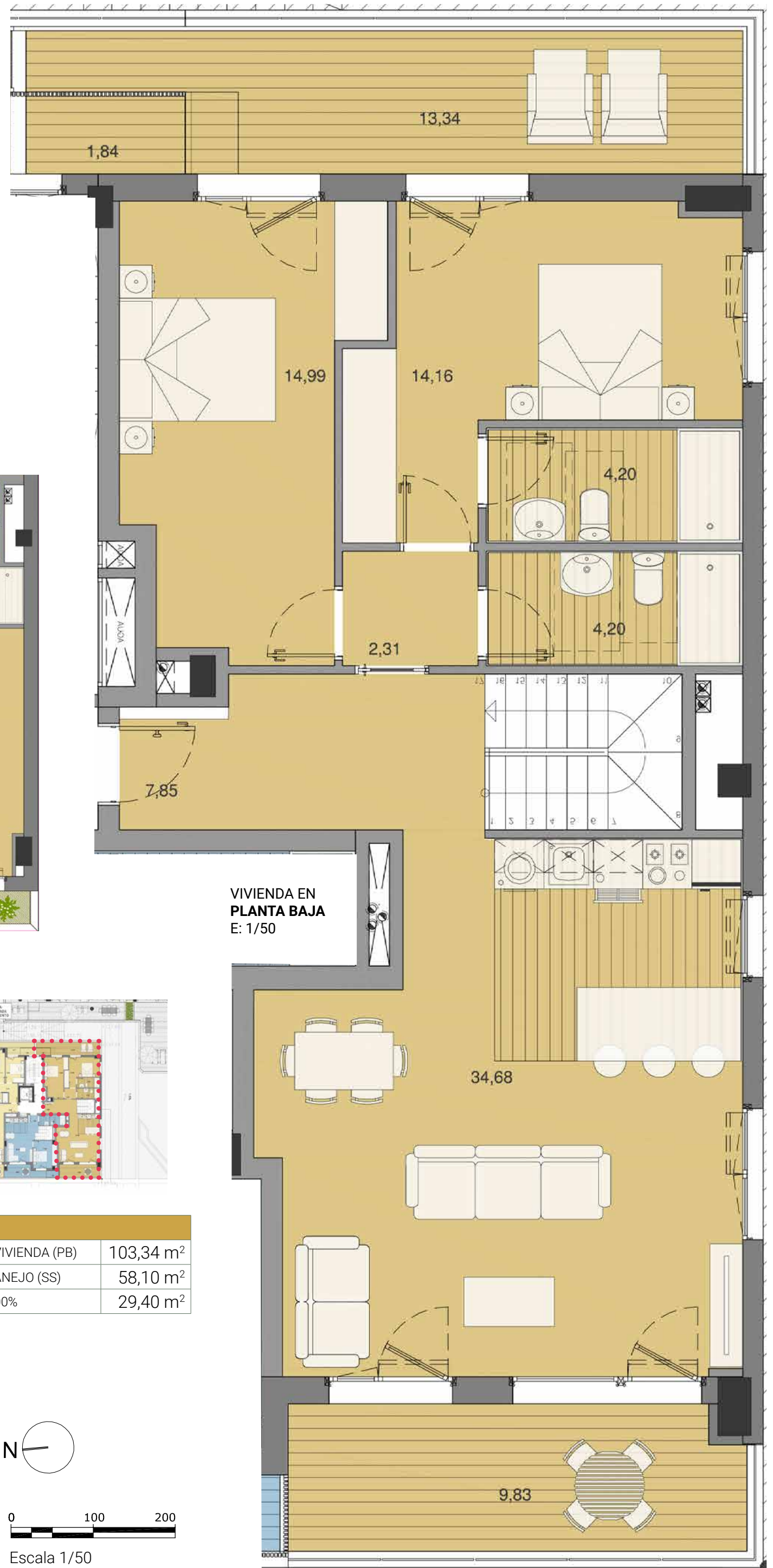
VIVIENDA EN PLANTA BAJA E: 1/50

618 614 541 E.: comercial@grupoeibar.com www.grupoeibar.com