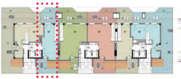
PORTAL3 · BC A(dúplex)

Medidas y distribuciones aproximadas. Disposición de mobiliario de cocina a definir. La dimensión de los pilares y mochetas especificadas en los planos de planta es la sección estándar, pudiendo aumentar o disminuir la misma por altura de la planta en la que se ubique la vivienda y por el paso de las instalaciones. Del mismo modo, pueden aparecer nuevas mochetas y pasos de instalaciones del edificio que no vienen reflejadas en los planos.