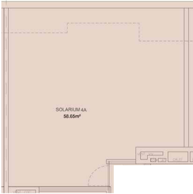
SOLARIUM EN P.Cub e: 1/100

Medidas y distribuciones aproximadas. Disposición de mobiliario de cocina a definir. La dimensión de los pilares y mochetas especificadas en los planos de planta es la sección estándar, pudiendo aumentar o disminuir la misma por altura de la planta en la que se ubique la vivienda y por el paso de las instalaciones. Del mismo modo, pueden aparecer nuevas mochetas y pasos de instalaciones del edificio que no vienen reflejadas en los planos.